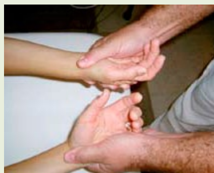
Test sin hipotonia.

En el plano PSICO-EMOCIONAL nos da acceso a los profundos bloqueos que el paciente puede arrastrar desde su etapa intrauterina, influencia del nacimiento, influencia