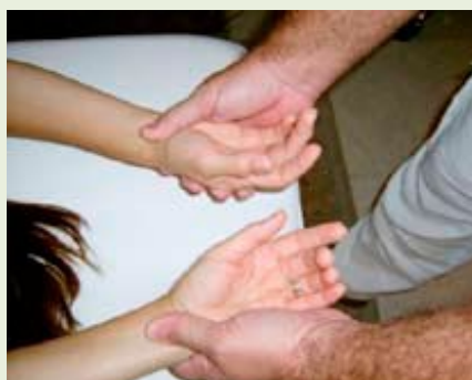
Test con hipotonia.

Basándonos en este reflejo, se han desarrollado sofisticados protocolos, totalmente basamentados, por los que podemos acceder a las causas originales de nuestros pro-